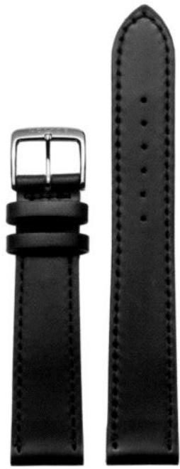
Shell Cordovan schwarz