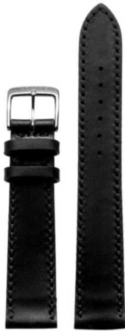
Shell Cordovan schwarz mit brauner Naht