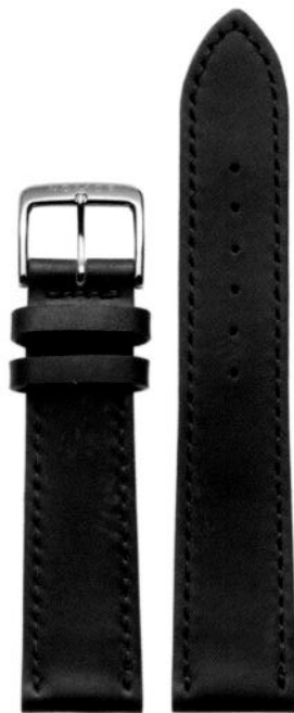
Shell Cordovan braun mit roter Naht