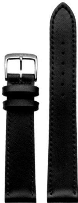
Shell Cordovan braun